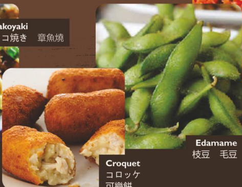
Edamame 枝豆 毛豆