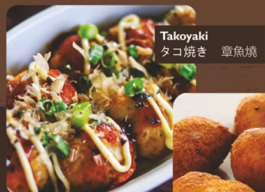
Takoyaki タコ焼き 章魚燒