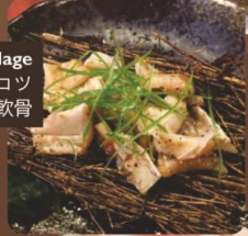
Chicken Cartilage とり ナンコツ 雞軟骨