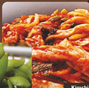
Kimchi キムチ 韓式泡菜