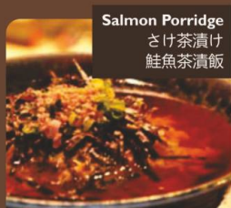
Salmon Porridge さけ茶漬け 鮭魚茶漬飯