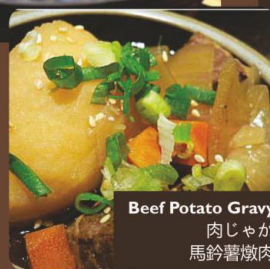
Beef Potato Gravy 肉じゃが 馬鈴薯燉肉