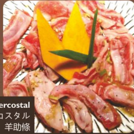
Lamb Intercostal ラム インタコスタル 羊助條