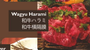
Wagyu Harami 和牛ハラミ 和牛横隔膜