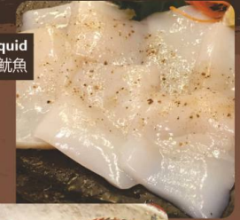
Squid イカ 魷魚