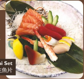
Sashimi Set 刺身 生魚片