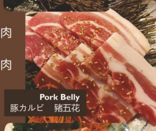
Pork Belly 豚カルビ 猪五花