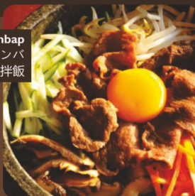
Bibimbap 石焼きビビンバ 石鍋拌飯