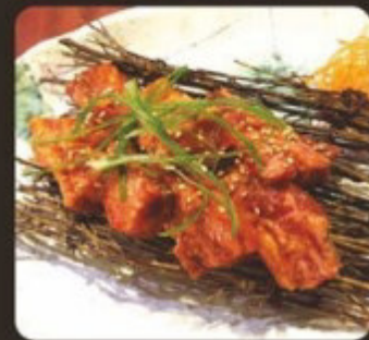
Wagyu Rib Finger 和牛牛肋條 和牛グタカルビ