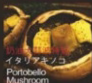
奶油太陽波持菇 イタリアキノコ Portobello Mushroom