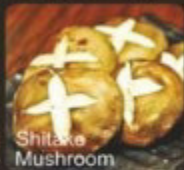
香菇 shitake しいたけ