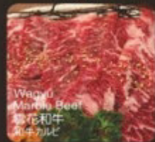
Wagyu Marbled Beef 雪花和牛 和牛カルビ