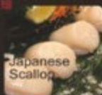
干貝 帆立 Japanese Scallop