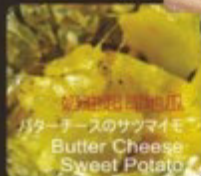
奶油起司地瓜 バターチーズのサツマイモ