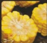
Sweet Corn コーン