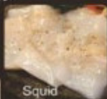
Squid 墨魚 墨魚