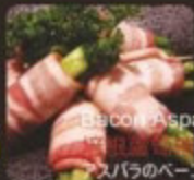
Bacon Asparagus 培根蘆筍 アスパラのベーコン巻