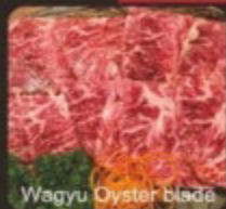
Wagyu Oyster blade