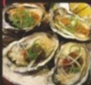
紐西蘭大生蠔 大力キ NZ Jumbo Oyster