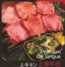
Premium Ox Tongue

牛肉為日式燒肉的上品， 主廚精選牛肉，其肉質鮮美、質地細嫩 搭配精心熬製的燒肉醬，口味獨特！