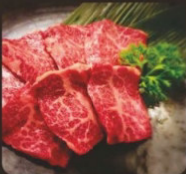
Wagyu Short Rib 和牛無骨牛小排 和牛上カルビ