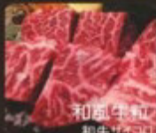
和風牛粒 和牛サイコロ