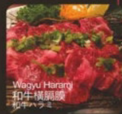
Wagyu Harami 和牛橫膈膜 和牛ハラミ