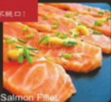
Salmon Fillet 鮭魚 鮭魚