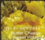
奶油起司地瓜 バターチーズのサツマイモ Butter Cheese Sweet Potato