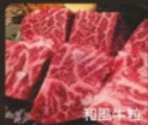
和風牛粒 和牛サイコロ