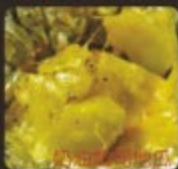
バターチーズのサツマイモ Butter Cheese Sweet Potato