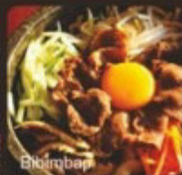
石鍋拌飯 石焼きビビンバ