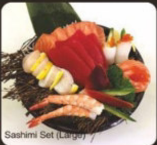
Sashimi Set (Large)