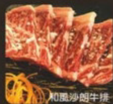
和風沙朗牛排 和牛サーロイン