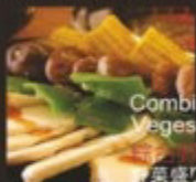
綜合野菜 野菜盛り合わせ