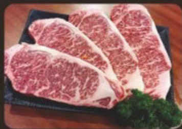
黃金和牛 黃金和牛 Wagyu MB9+ Striploin / Cuberoll