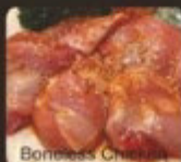
Boneless Chicken Thigh