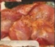
Boneless Chicken 無骨雞腿肉 とりもも肉